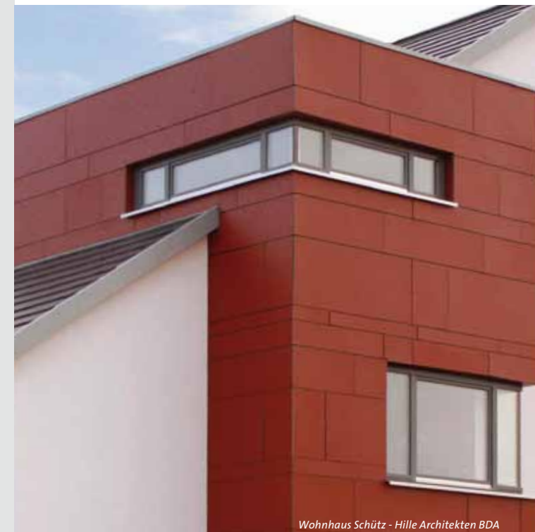
Wohnhaus Schütz - Hille Architekten BDA

Die Teilnahmebestätigung wird am Ende der Veranstaltung ausgehändigt.