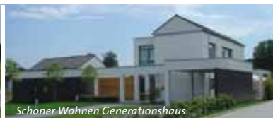
Schöner Wohnen Generationshaus